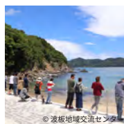
波板地域交流センターでのイベント