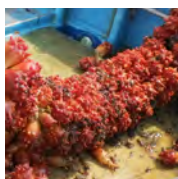
ほや収穫体験 in 雄勝