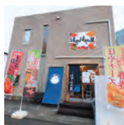
ほやほや屋 (塩釜市北浜)