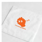
ほやベイビーハンドタオル (イメージ)